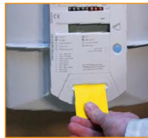
budgetmeter voor aardgas