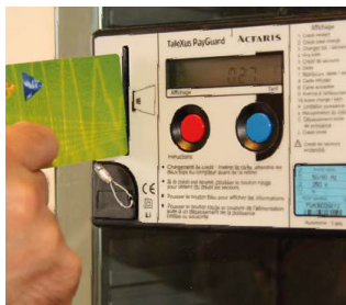
Budgetmeter voor elektriciteit

Als u in uw oude woning zelf geen budgetmeter had, moet u zo snel mogelijk aan uw leverancier en aan uw distributienetbeheerder melden dat er een budgetmeter in uw nieuwe woning is. Uw netbeheerder zal de budgetmeter desactiveren zodat die terug werkt als een gewone meter.